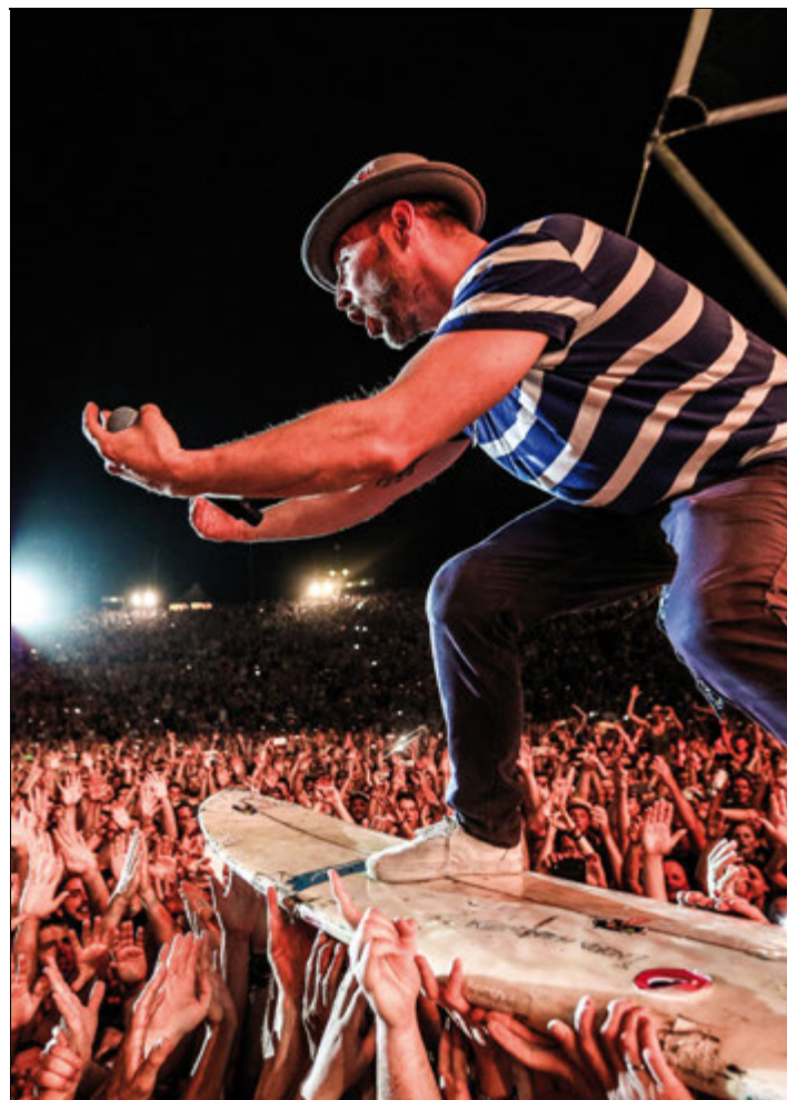
Surfkurs inklusive: Die Beatsteaks sind Deichbrand-Headliner

Denn ohne Frage trifft man hier den Nerv eines stilistisch offenen Publikums: Hochkarätige internationale Headliner und nationale Topacts werden im Sommer den See-Flughafen beehren. Vier Tage Ausnahmezustand! Die Vorzeichen stehen gut, dass man zur Festival-Championsleague von Rock am Ring