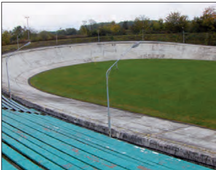
Leer und sinnlos: Die Radrennbahn

Weinmarkt: Einmal im Jahr im September trifft sich Bielefelds oberstes Bürgertum, um sich gemeinsam in der Altstadt mit den erlesensten Weinen gepflegt volllaufen zu lassen.