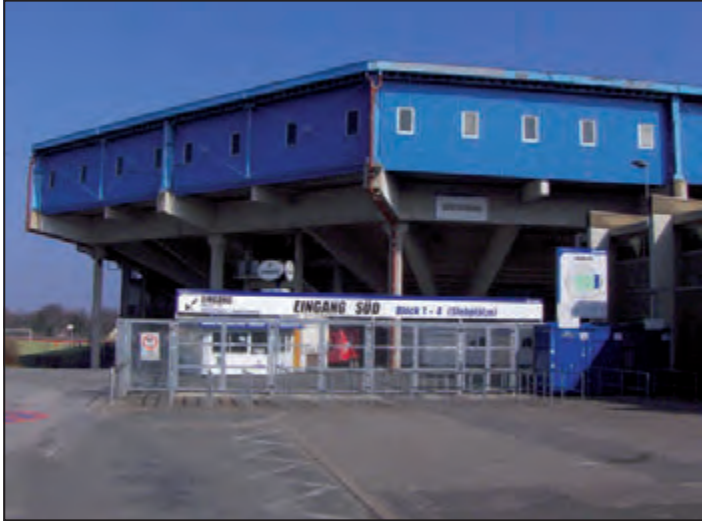
Heimat der Niederlagen: Die Bielefelder Alm

nebenan werden dadurch leider auch nicht schöner. Und für das Café ist der Stadt sowieso gerade das Geld ausgegangen.