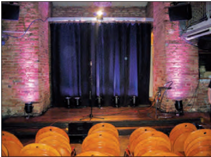
Orte homerischen Gelächters: Die Zweischlingen-Bühne

gelingt es tatsächlich, es nicht peinlich und unerträglich zu gestalten.