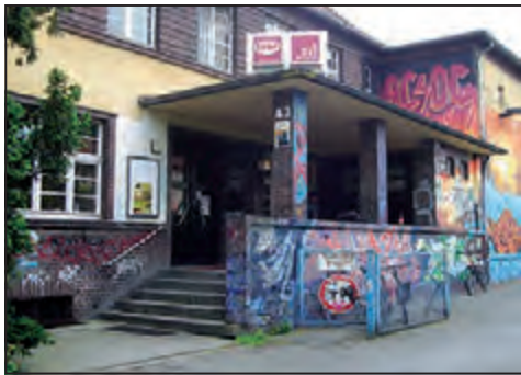
Bald ohne Events: Das „Kamp“

im Jugendzentrum vorbei schaut. Seit ein paar Wochen ist allerdings klar, dass das Kulturkombinat Kamp zum 30. Juni seine Arbeit einstellen wird. Neben kleinen Reibereien mit der Stadt und den Falken (denen das Kamp gehört) war vor allem zunehmender Ärger mit Nachbarn Grund für das Ende. Die wollten nämlich nicht mehr den Lärm ertragen, der besonders nach den Partys sich im Wohngebiet breitmachte; von den zerdepperten Flaschen und Gläsern im Vorgarten ganz zu schweigen. Ob´s woanders mit dem Programm weitergeht, steht im Moment in den Sternen, ist aber eher unwahrscheinlich.